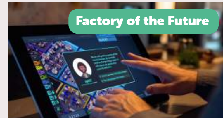
Factory of the Future